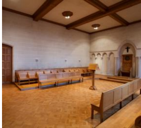
© Kikirpa - Bruxelles clichés X070024

Les Amis de l'Abbaye de Maredret a.s.b.l.